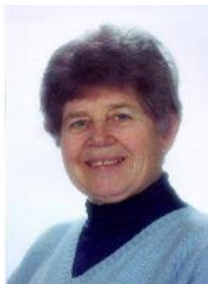
Dr. Hulda Clark

Die Anwendung des Zappers bei gesundheitlichen Beschwerden ersetzt weder den Besuch eines Arztes noch rechtfertigt sie den Abbruch einer bestehenden Behandlung! Bei viele alternative Verfahren ist die Wirksamkeit nach rein schulwissenschaftlichen Kriterien bis heute nicht zu beweisen dies gilt auch für den Zapper nach Dr. Hulda Clark. Die Informationen auf dieser Seite basieren auf den Büchern von Dr. Hulda Clark. Beachten Sie bitte auch unseren Rechtshinweis.